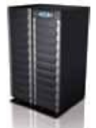
100-120 kVA + Батарейный кабинет