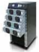
Масштабируемость и горячая замена